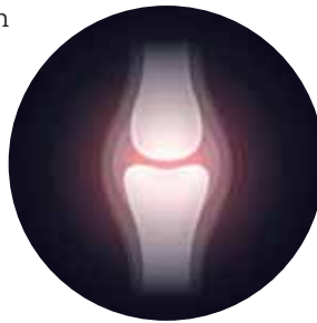
Das Gelenk als Verbindungsstück zwischen zwei Knochen ist wichtig für die Beweglichkeit. Gelenkschäden schränken ein und schmerzen.

(Quelle: PM Deutsche Gesellschaft für Schmerzmedizin e.V.; * www.g-ba.de/downloads/39-261-3493/2018-09-20_Endbericht-Gutachten-Weiterentwicklung-Bedarfsplanung.pdf )